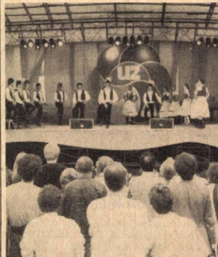
Népi együttesünk a színpadon.